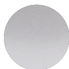
acciaio inox 316