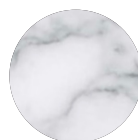
marmo bianco di Carrara

Materiali: marmo bianco di Carrara, acciaio.